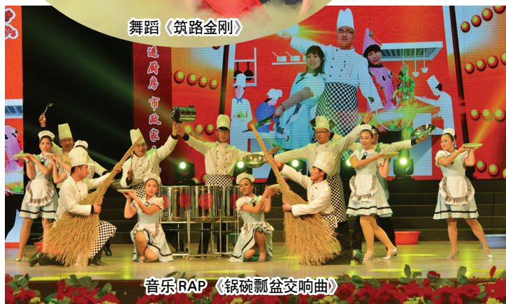
音乐RAP《锅碗瓢盆交响曲》