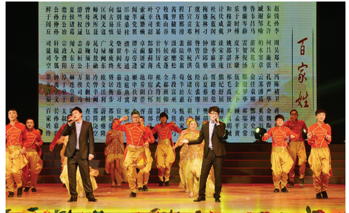
歌伴舞《百家姓 中华情》