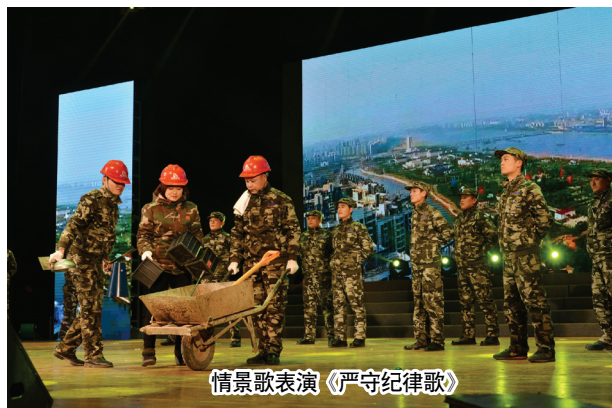
情景歌表演《严守纪律歌》