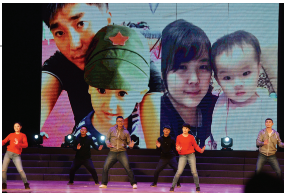
现代舞《市政萌萌哒》