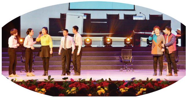
情景表演《亲情电话》