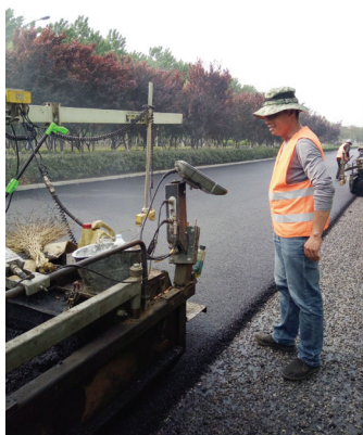
▲杭州路沥青摊铺现场