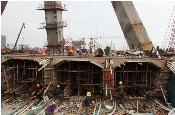
▲西安路沭河桥施工现场

米，已完成4082米；路基回填方料160246立方，已完成46949立方。电力方涵、过路桥涵也在积极推进中。