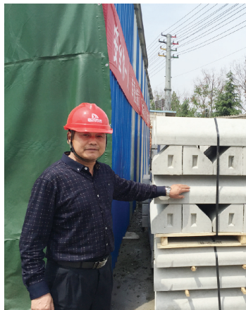
▲众信建材临港构建厂区