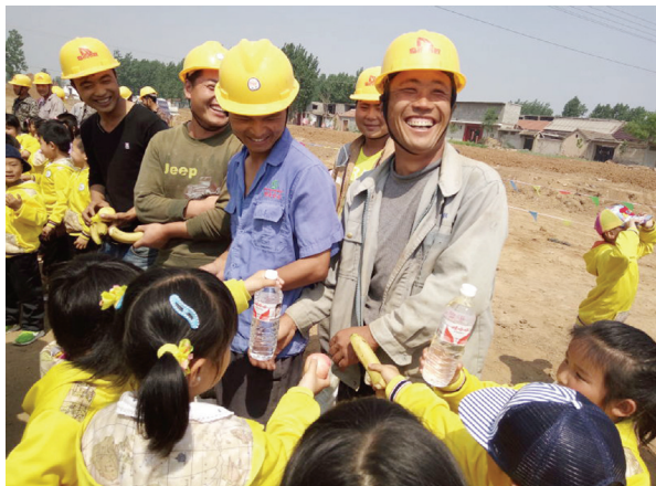
▲附近幼儿园到中环北线参观

中环北线总造价15005.7万元，现已完成产值1375.94万元。其中，雨水工程7755米，已完成3471米；污水工程7816