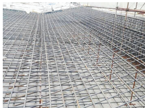
一公司陷泥河小庄子闸钢筋绑扎好