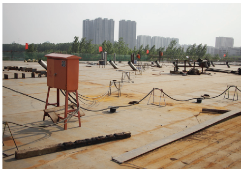
一公司西安路沭河桥临时用电线路布设创新