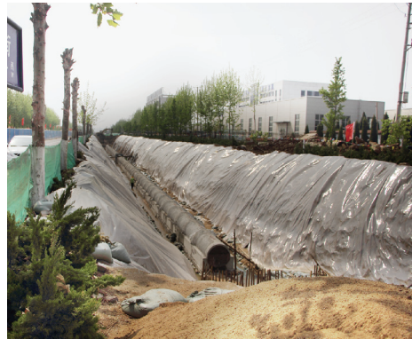
二公司南京东路污水工程沟槽施工安全措施到位