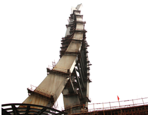
一公司西安路沭河桥塔柱安装拼接质量好线形圆顺